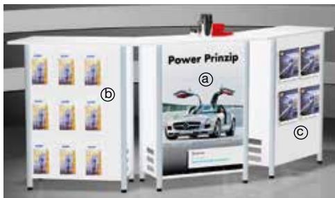
Die Counter lassen sich zu einer Thekenanlage aneinander reihen.