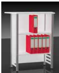
Rückansicht des Counters

Zubehör: (a) Plakattasche DIN A1, (b) Prospektfach DIN-lang, (c) Prospektfach DIN A4 siehe oben