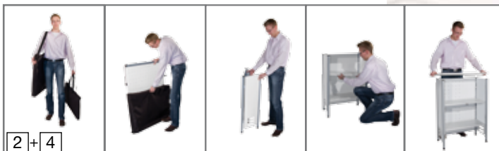
Counter: Transport und Aufbau